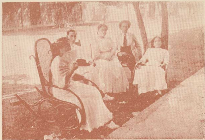
El veraneo en Puntarenas.—Después del almuerzo, los veraneantes forman corrillos como este, bajo la sombra de los árboles de las calles, frente a los hoteles