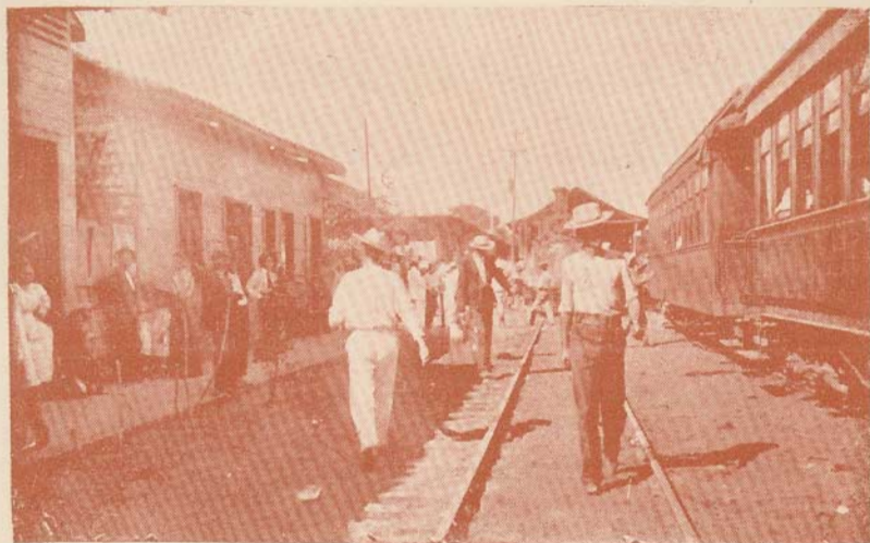
El veraneo en Puntarenas.—Salida del tren de pasajeros para San José

autógrafa en que el Papa le manifiesta su reconocimiento por los servicios que ha prestado á la Iglesia. A pesar de esto, Rampolla y otros Cardenales van recobrando su preeminencia cerca del Papa, con detrimento de Merry del Val.