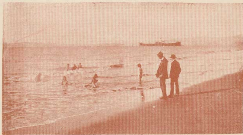
El veraneo en Puntarenas.—Excursionistas bañándose en la playa

cortado en forma de pequeña melena, á estilo de los románticos. Fernando lucía el bigote recortado y breve perilla; Thuillier, sotabarba, muy rasurada en la parte de las mejillas; recordaba algunos retratos de don Salustiano Olózaga y del primer Marqués de Pidal.